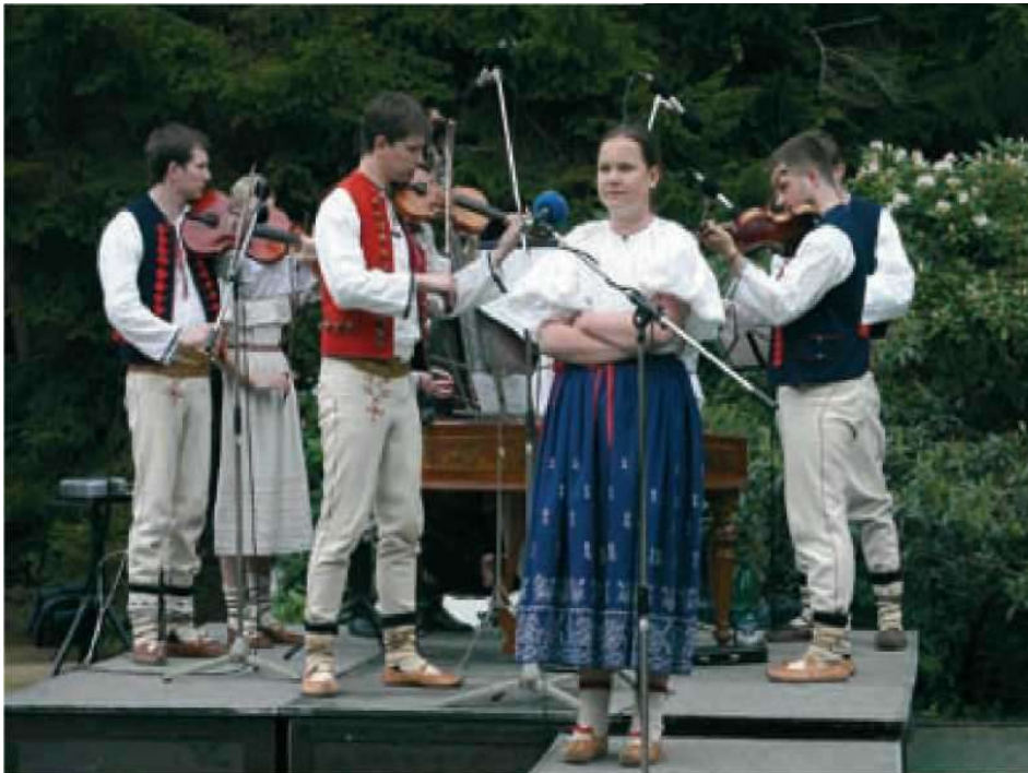
10 Cimbálová muzika Vojtek při soutěži (F. Synek)