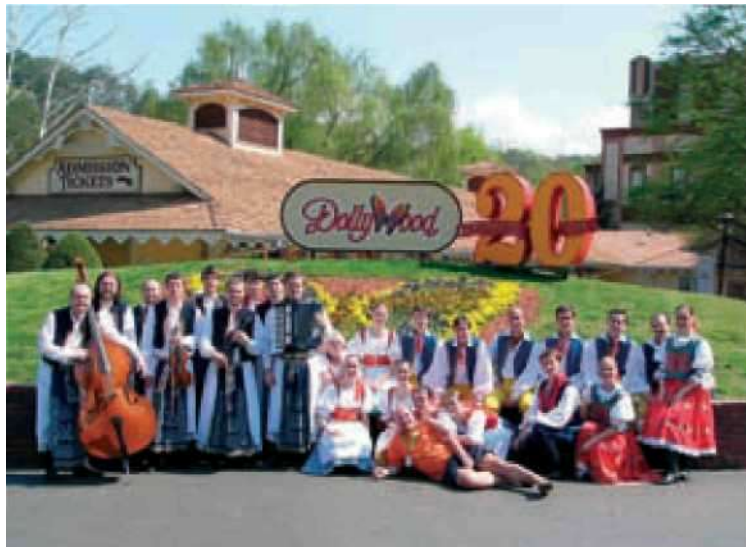
12 Soubor Ondráš v Americe (F. Synek)