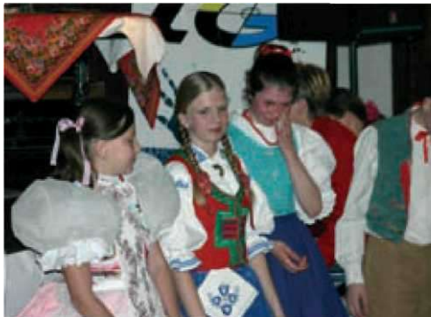
7 Část vítězů soutěže (F. Synek)