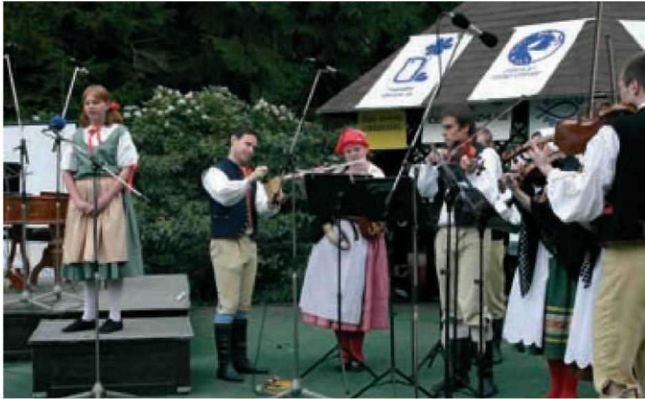
11 Česká lidová hudba při soutěži (F. Synek)